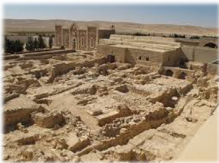
Vista Esterna del Monastero